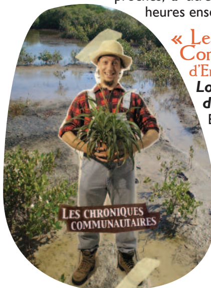
Troupe « Loco Motiv » de Québec