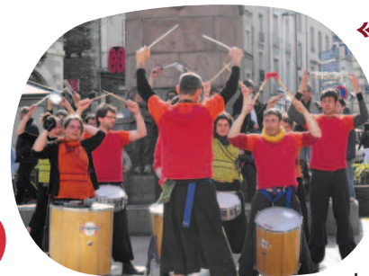
« Saperkupopett »