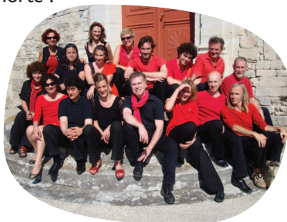
« La chorale du Delta »

- La Baronnie de Douvres - Grand Feu d'artifice